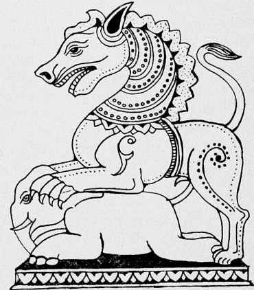
সিংহ হস্তী মূৰ্তি ধৰ্মৰ মহাপুৰুষীয়া নন্দৰ শিত্ৰত থকা সিংহাসনৰ একাংশ)