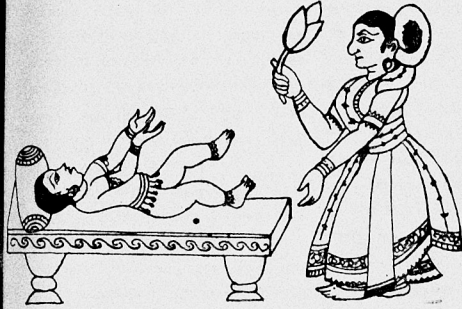
নন্দৰ গৃহত পুত্ৰনাৰ প্ৰবেশ (চিত্ৰ-ভাগৱত)

ছবিখনিৰ শোঁকালে গুণ সিংহাসনত শুকদেৱ আৰু বাউঁফালে মহাবাজ পৰীক্ষিত আঠ, লৈ কৰাৰোৰে নিৰ্ণ আসনত বহিছে। শুকদেৱৰ সমস্ত শৰীৰ নীলা বঙৰ। তেওঁ নগ্ন অৱস্থায়